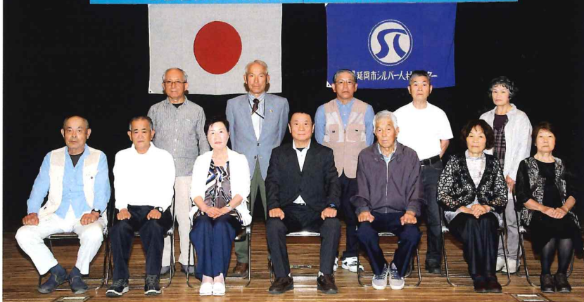
▲ 10年・20年感謝状を受けられた方々と理事長・副理事長です。